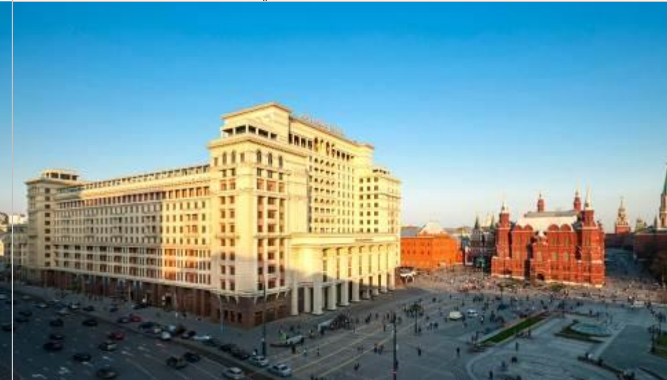
FOUR SEASONS HOTEL MOSCOW ( 3 NIGHTS )

บินลัดฟ้าเปิดดินแดนหลังม่านเหล็ก สัมผัสดินแดนหมีขาว "รัสเซีย" อดีตประเทศมหาอำนาจระดับโลกสังคมนิยม ที่ปัจจุบันระบอบการปกครองเป็นประชาธิปไตยแบบตะวันตก ความยิ่งใหญ่ของพระราชวังสถาปัตยกรรมของรัสเซีย หลังป้อมปราการ เคมลิน กำแพง โบสถ์รูปโดมหัวหอม ล้วนงดงามเก่าแก่ตั้งภายในจินตนาการ นำท่านท่องเที่ยวชมเมืองมอสโกว์ และเซ็นต์ปีเตอ์สเบิร์ก ที่มีคุณค่าทางประวัติศาสตร์ วัฒนธรรม และสถาปัตยกรรม กับเรื่องราวต่าง ๆ ที่กำลังนำท่านไปสัมผัส ด้วยบริการครบถ้วนสมบูรณ์แบบ จากทีมงานมืออาชีพ