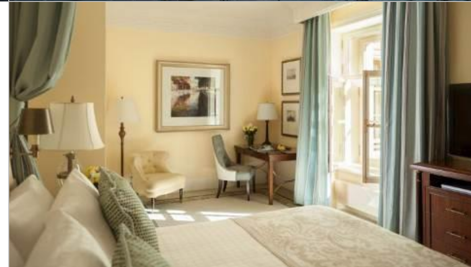
FOUR SEASONS HOTEL ST. PETERSBURG ( 3 NIGHTS )